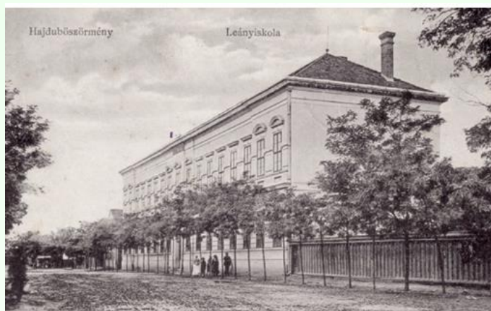
Hajdúböszörményi Leányiskola, 1907.

Tény, az utazó, aki a századfordulón Bösörménybe látogatott lépten-nyomon megtapasztalta, hogy a település virágkorát élte: a város anyagi javakban és népességszám tekintetében is gyarapodott. Ugyanis amíg pl. az 1894/95-ös tanévben az elemi iskolába járó gyermekek létszáma csaknem 2300 volt, addig az 1902/03-as tanévben már elérte a 3776 főt. A helyi „közoktatás” megújítása tehát elkerülhetetlenné vált. A Vallás és Közoktatási Minisztérium 1904. március 31-én főgimnáziumnak nyilvánította a helyi középiskolát, ezért az épületben működő elemi fiúiskolát kiköltöztették az épületből. A század eleji nagy építkezéseknek köszönhetően jöttek létre Hajdúböszörmény meghatározó oktatási intézményei, melyek a közös történelmi múlt és örökség okán a városvezetés patronálásával a helyi református egyház fenntartásában álltak: a Bocskai István Gimnázium és a szorosban hozzá kapcsolódó Kálvineum, a Központi Fiú- és Leányiskola, Polgári Leányiskola (később: Baltazár Dezső Polgári Leányiskola), a Bethlen utcai, Kálvin téri és Szekeres-közi református iskola. A megannyi diák, tanító és iskolaépület ellenére az oktatás, egészen 1908-ig egyetlen elemi iskolai igazgató felügyelete alatt állt, s csak ezt Hajdúböszörményi Leányiskola, 1907.