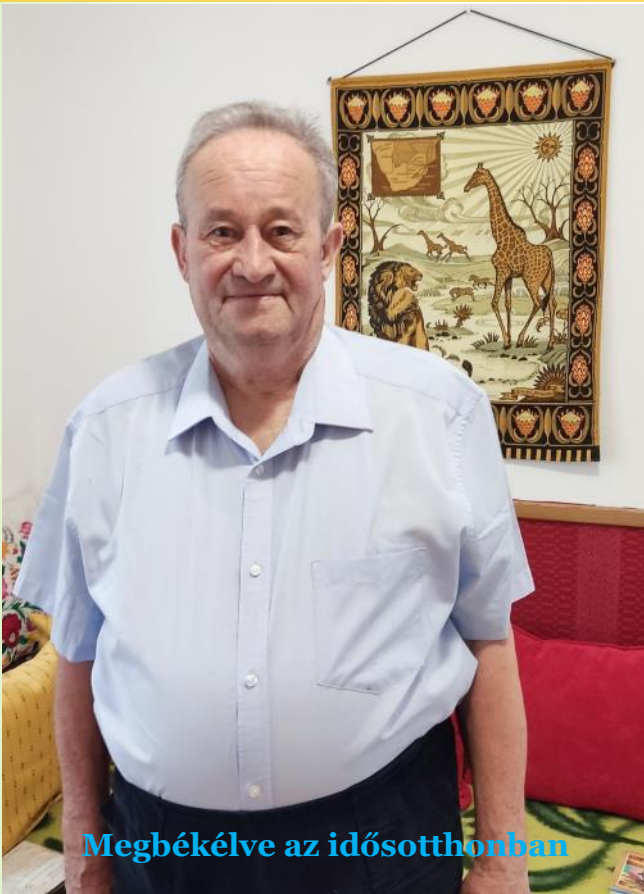
Megbékélve az idősothtonban